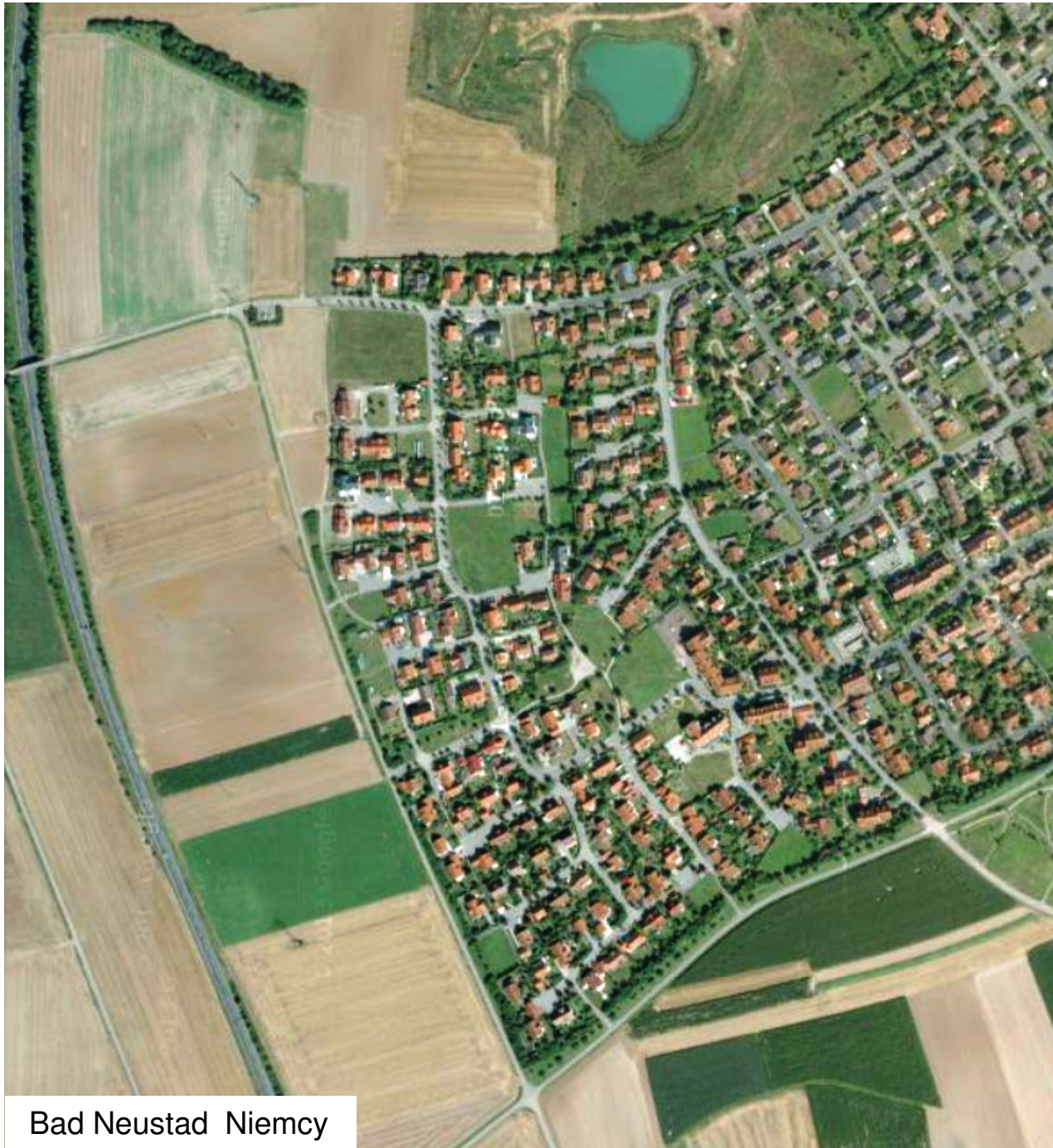
Bad Neustadt Niemcy