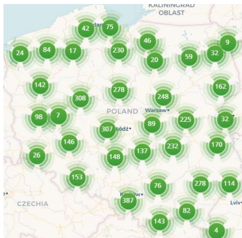
Banki Spółdzielcze (Placówki i bankomaty)